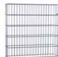
RANKO Gabione ohne angeschweißte Pfähle