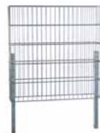
RANKO Gabione mit angeschweißten Pfählen