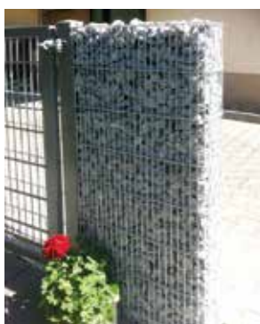
RANKO Gabione mit Maschenweite 25 x 200 mm

Gabione Typ 2m Breite: 2010 mm Tiefe: 165/262 mm